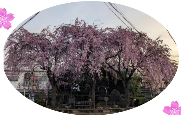
大仏記念公園のしだれ桜