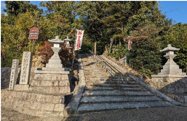
☆添御縣坐神社(そうのみやあがたにいますじんじゃ)

延喜式内社 添御縣坐神社（えんぎしきないしゃ そうのみやあがたにいますじんじゃ）富雄三碓町（みつがらすちょう）にある難読の神社、この辺りの氏神様であり、秋には地元小学生が神輿を担いで地域を練り歩く、極めて格式の高い古社でもあります。この神社に隣接する寺に三碓の地名の起源となったと言われる3つの窪みのある石（碓）があります。奈良時代この地域を治めていた小野氏（小野妹子の子孫）がこの碓を使用して穀物をついでいた姿を聖武天皇が見てこの地を「三碓」と名付けたと伝わります。