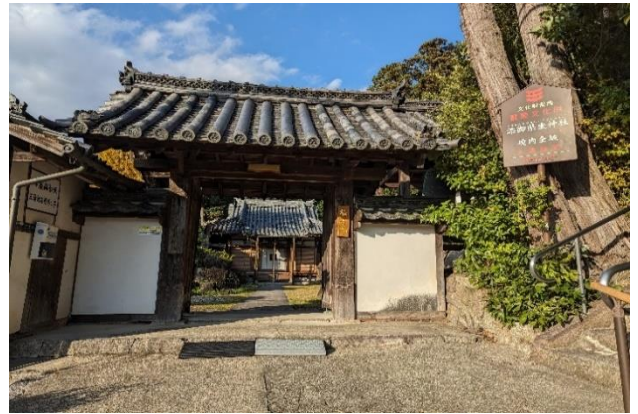
☆根聖院(三碓の語源石がある寺)