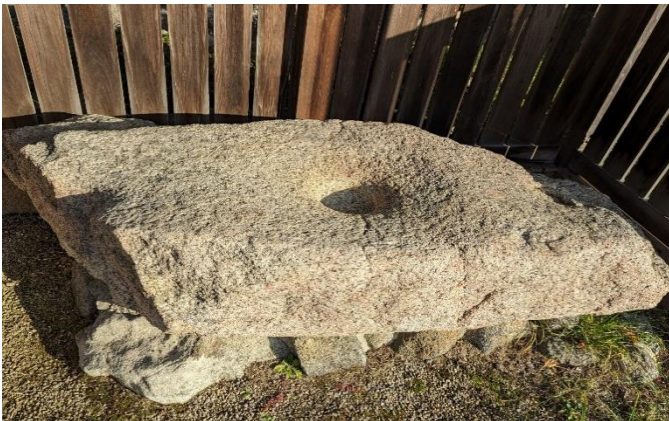
☆三碓の語源の石碓